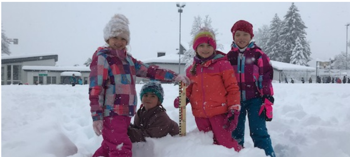
Bild: 58 cm Neuschnee in Bubikon am 15.1.2021