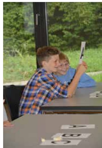
Verschiedene Fragen wurden beantwortet und Sugus gewonnen.

Etwas nervöse Gesichter konnten am ersten Schultag der neuen Schüler/innen in der Aula beobachtet werden. Kaum