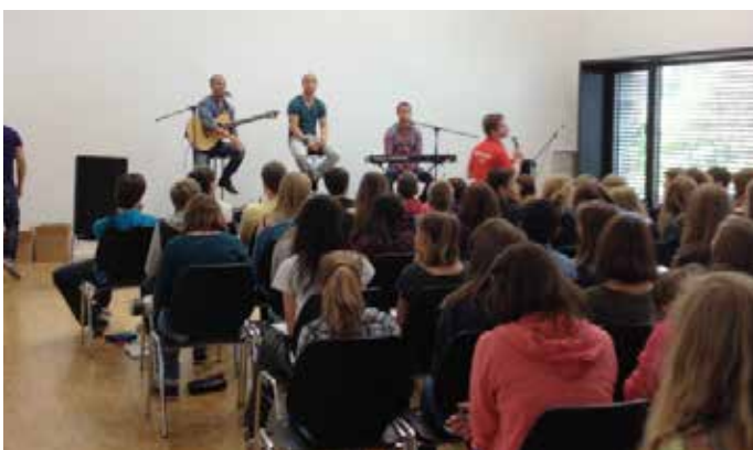
Die Drillinge unterhielten die Zuschauer/innen in Französisch

Zusätzlich zum Auftritt gab es noch ein Gewinnspiel für die Jugendlichen. Sie mussten einen Lückentext zum ersten Lied der „3nity brothers“ ausfüllen und konnten dabei einen Eintritt in den Europapark gewinnen. Unter allen Teilnehmenden dieser Tournee wird am Ende sogar noch ein zweiwöchiger Sprachaufenthalt verlost. Die Jugendlichen und auch die Lehrpersonen waren begeistert vom Auftritt der 3nitybrothers: