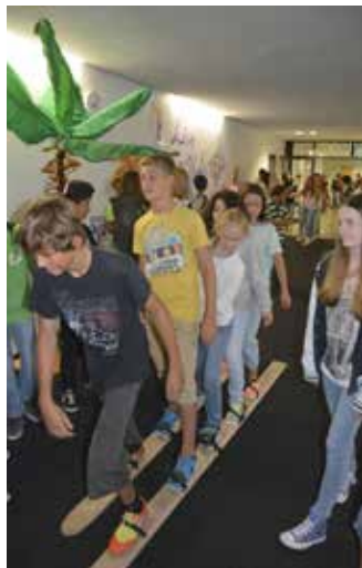
Übertritt mit Skiern

Lehrpersonen an die neue Situation gewöhnen. Zimmer mussten gefunden, neue Schulbücher geschleppt und natürlich viel geleistet werden. Das gelang im Allgemeinen sehr gut. Die Schulleitung und die Lehrpersonen gratulieren den Schüler/innen zum gelungenen Übertritt und freuen sich auf die kommenden Schuljahre.