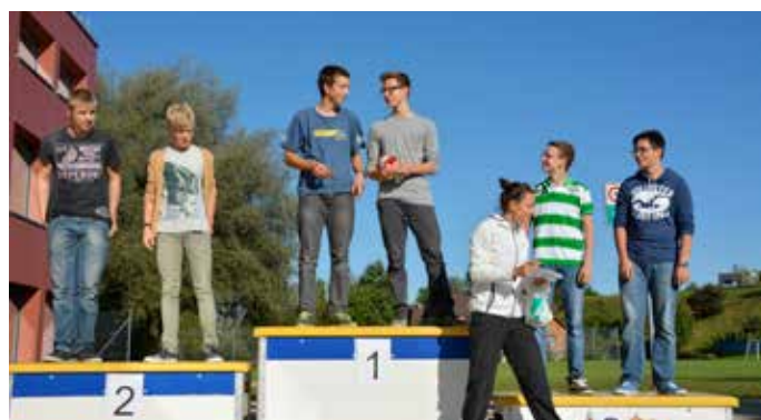
Mit sagenhaften 41 Punkten zum neuen OL-Rekord und Platz 1!

Herzliche Gratulation an alle Teilnehmer/innen, welche ein gutes Resultat erreichen konnten!