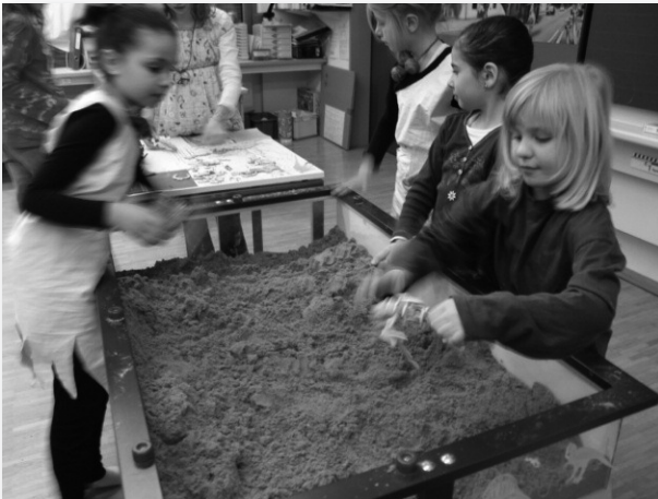
Eifrig suchen die jungen Archäologen im Sand nach den Knochen eines Dinosauriers.