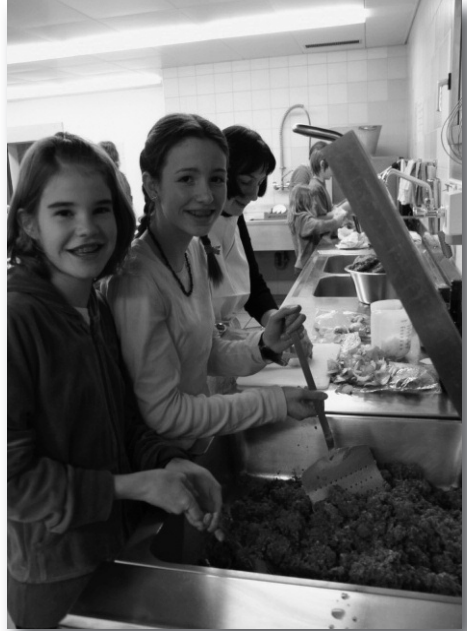
Vorbereitungen am Nachmittag in der Küche für «Ghackets und Hörndli», dem Hauptgericht im mittelalterlichen «Gasthaus Eidgenossen».