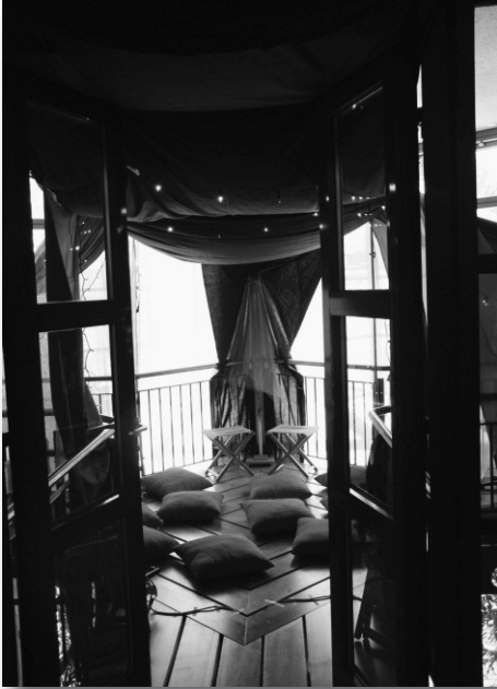
Geschichten hören aus der griechischen Sagenwelt im Sternenzelt der Zweitklässler.